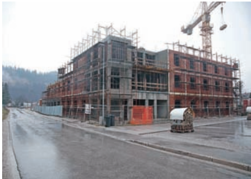
V Žireh hitro napreduje gradnja doma za starejše.