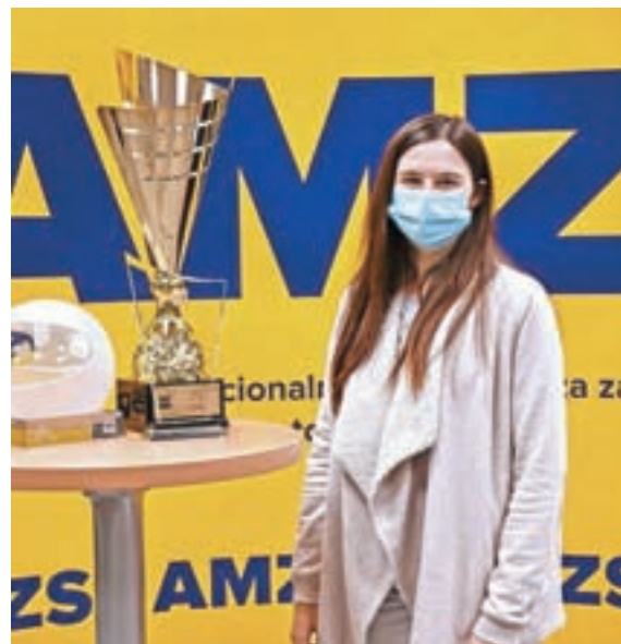
S pokali AMZS

Za vsakim dosežkom in dirko stojijo tudi stroški. Večino stroškov nosi njena družina, to pa pomeni veliko odrekovanja in