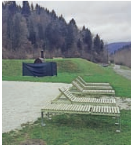
Ležalniki, s katerimi bodo opremili kopališče Pustotnik