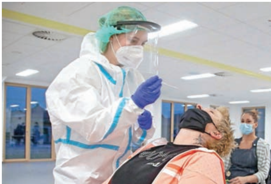
Hitro testiranje na okužbo z novim koronavirusom so omogočili tudi v Žireh.

Da se bo delež okužb v žirovski občini še naprej zmanjševal, pa ostaja odgovornost vseh občanov, saj lahko le skupaj, z upoštevanjem preventivnih ukrepov, cepljenjem ter odgovornim ravnanjem do sebe in drugih virus tudi premagamo.