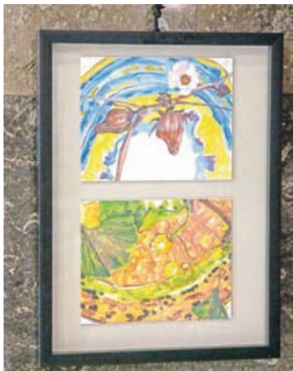
V manjšem formatu