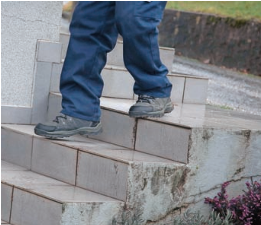
Za preprečevanje padcev lahko največ naredimo sami.

Kaj pa vam pomaga, da se pozimi obvarujete padca? Kaj novega bi še lahko preizkusili? Če želite izmenjati svoje izkušnje na to temo, v Žireh deluje več skupin za preprečevanje padcev, ki jih vodimo prostovoljci. Za konec tako še ugotovitev, do katere pogosto pridemo v skupinah: vsak lahko pade in večina padcev se na koncu dobro razreši, zato naj nas tega ne bo pretirano sram ali strah, obenem pa naredimo vse, kar je v naši moči, da padelec preprečimo.