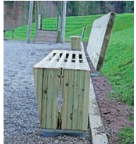
Klop iz odsluženega lesa

prehod v krožno gospodarstvo je poudarila, da krožno gospodarstvo pomeni spremembo našega načina življenja in odnosa do vsega, kar ustvarjamo. "Iščemo rešitve pri snovni in energetski učinkovitosti vsakega posameznega izdelka, da bi bil čim dlje v uporabi in bi ga lahko ponovno uporabili." Prepričana je, da imamo na področju krožnega gospodarstva v Sloveniji veliko znanja in potenciala. Tudi raziskovalec v centru odličnosti InnoRenew Igor Gavrič meni, da ima Slovenija velik potencial za ponovno rabo lesa. "Obenem pa je pri tem veliko izzivov, kako pridobiti ves odsluženi les in kako ga ustrezno procesirati." Ob tem je direktor podjetja M Sora Aleš Dolenc poudaril, da imamo v Sloveniji in Evropi lesa za zdaj še dovolj, obenem pa les velja za obnovljiv, ekološko sprejemljiv naravni material, ki ga v končni fazi lahko uporabimo tudi kot energent, zato manj pogosto razmišljamo o njegovi ponovni uporabi. A podnebne spremembe bodo po njegovih besedah situacijo dramatično spremenile, zato se v njihovem podjetju trudijo ukvarjati s ponovno uporabo lesa. Nakup