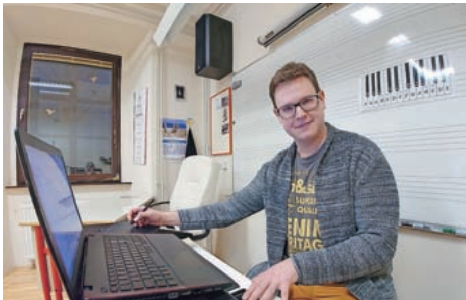
Delo na daljavo je kljub moderni tehnologiji za učitelje velik izziv.

Bolj kot Istran se počutim Primorec – nekako sem gravitiral na kraje v Vipavski dolini, kjer sem preživel tudi srednješolska leta. V meni je nekako vedno tlela ideja o tem, da bi želel ljudem pomagati ali jih voditi skozi izobraževanje, saj sem prepričan, da je merilo napredka samo to, koliko znanja (izkušenj) uspe ena generacija predati drugi. Zdi se mi, da sem se kot učitelj zelo lepo ujel s kolektivom glasbene šole, pa tudi učenci so me hitro in zelo lepo sprejeli. Slednjim se res zahvaljujem za konstruktivno delo, ki ga opravljajo na daljavo, glasbeni šoli pa za podporo v obliki urejenega učnega procesa. Pa tudi