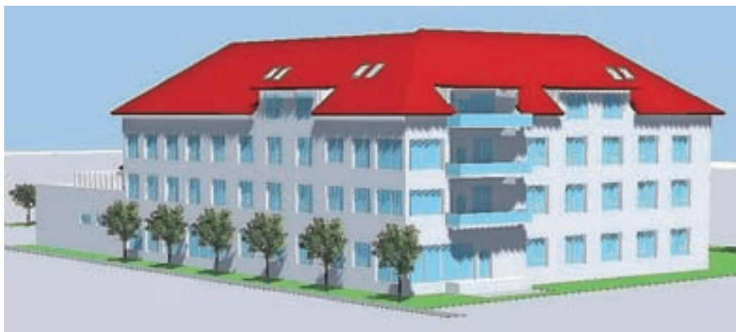
Dom v Žireh

SeneCura je lastnica doma starejših občanov v Vojniku, Mariboru in Radencih ter dializnega centra v Vojniku, ki deluje pod blagovno znamko OptimaMed. V Sloveniji v dogovorih z občinami poleg gradnje doma v občinah Žiri in Hoče - Slivnica načrtujejo še gradnjo nekaterih drugih manjših domov, na primer v Pivki in Komendi.