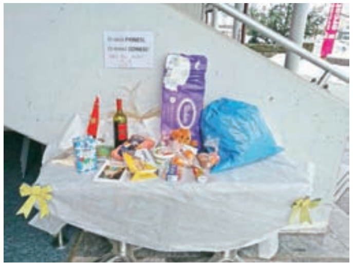
Mizica je bila kmalu polna dobrot.