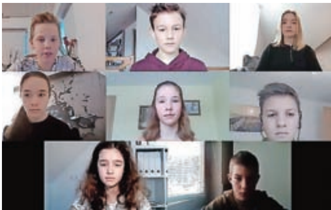
Sedmošolci OŠ Žiri so na daljavo recitali Glosu.

Proslavo ob slovenskem kulturnem prazniku so si učenci Osnovne šole Žiri letos ogledali na daljavo. Včasih oziroma v časih, ko smo se lahko družili brez mask, brez razdalje, smo program ob slovenskem kulturnem prazniku na Osnovne šole Žiri običajno predstavili na odru žirovske kulturne dvorane. Letos so si v petek, 5. februarja, zadnji šolski dan pred slovenskim kulturnim praznikom, učenci naše šole proslavo ogledali na daljavo. V čast