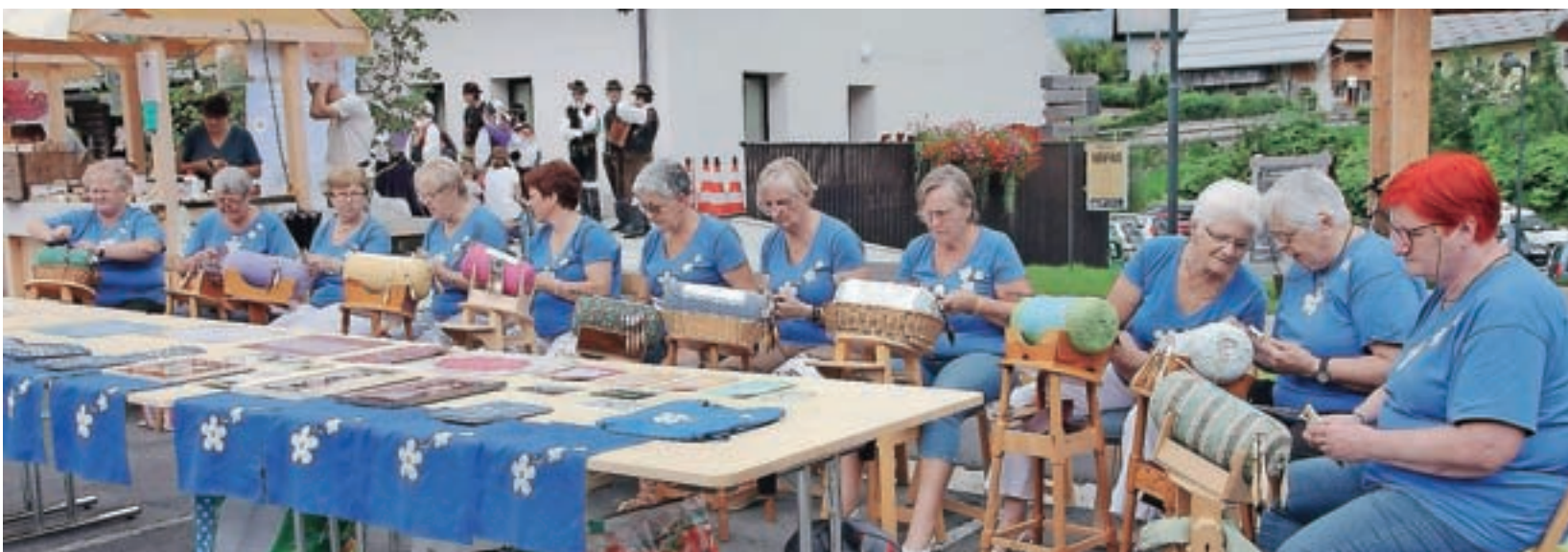
Cvetke v Bohinju na turistični prireditvi Slovenija se predstavi